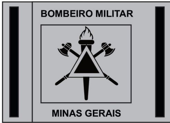
Fig. 1: Fivela do cinto de guarnição fechada